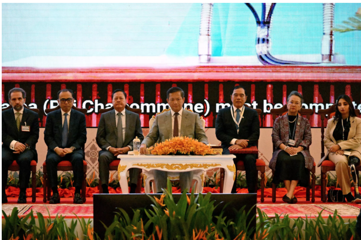
5ème conférence de la convention d'Ottawa, Cambodge

devenu un précurseur mondial en termes de déminage. Alors que les États-Unis ont autorisé la livraison de mines à l'Ukraine, le ministre d'État cambodgien Ly Thuc appelle les pays non-signataires à rejoindre la lutte contre le fléau de ces mines.